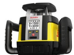
Rotations- & Neigungslaser