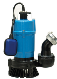
Pumpen-Prüfung nach DGUV 3